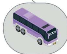
Автобус междугородного/международного следования

Проявите гражданскую позицию, поддержите «Стратегию Ноль» в России. Поделитесь с друзьями и близкими той информацией, которая показалась вам важной. Сделайте фотографию и разместите в VK Instagram Facebook #СТРАТЕГИЯНОЛЬ и #РОССИЯБЕЗДТП